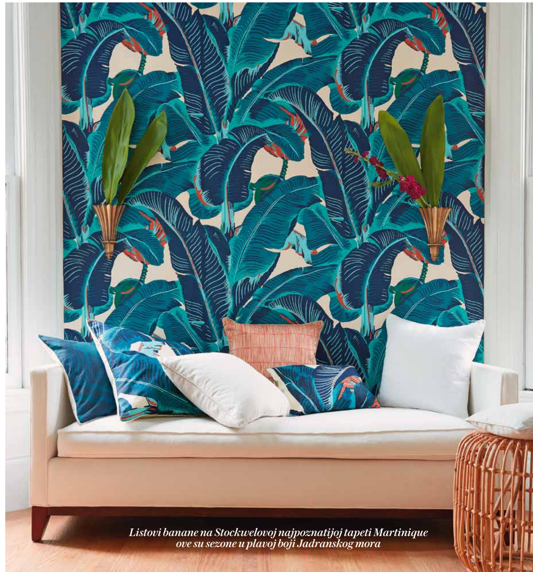
Listovi banane na Stockwelovoj najpoznatijoj tapeti Martinique ove su sezone u plavoj boji Jadranskog mora